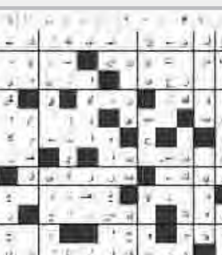
حل العدد السابق