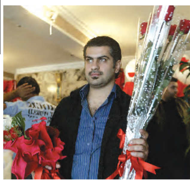
شاب يشتري الورود في بغداد بمناسبة عيد الحب