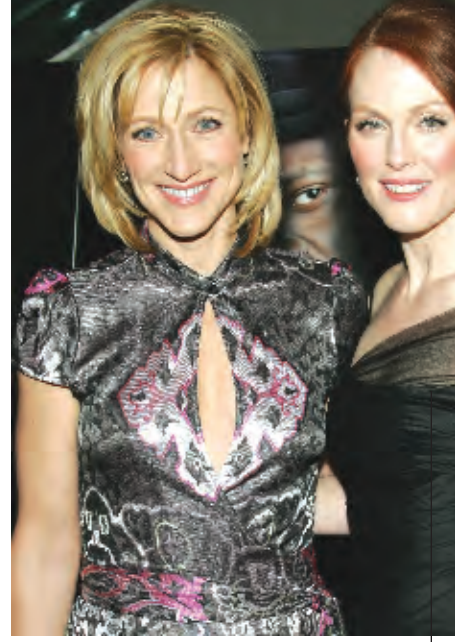
المتلة ايدي فالكو وجوليانا مور على خشبة المسرح في نيويورك