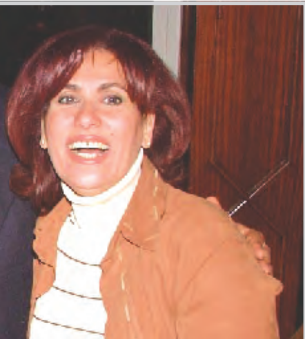
بغداد / فيات الربيعي صدر العدد الثالث من مجلة (هلا شباب) الشهرية التي تعنى بشؤون الرياضة والشباب، وضم العدد مجموعة من المواضيع الرياضية والثقافية والاجتماعية منها موضوع تحت عنوان (وضع الحجر الأساس للعبة بغداد الدولي) و(وزير الشباب يعرض احتفالية الزمان الرياضي) وموضوعات أخرى جاءت تحت عنوان (شبابنا ومخاطر البث الاعلامي المباشر). (المتحف البغدادي بانتظار من ينفض عنه الغبار).

القاهرة / وكالات أكد الدكتور محمود النمى، نائب رئيس مستشفى عين شمس التخصصي، أن جميع شروط الوفاة الاكلينيكية توافرت لدى الفنانة الكوميديّة سعاد نصر، التي نقلت إلى المستشفى منذ أسبوع لإكمال علاجها، ولكنها لم تستجب لمحاولات الأطباء في إفاقتها من الغيبوبة التي أصيبت بها منذ ما يقرب من شهرين نتيجة لرفض المخ العودة إلى طبيعته الأولى. وأضاف الدكتور النمى أنه نتيجة لتوقف المخ عن أداء وظائفه فإنه من