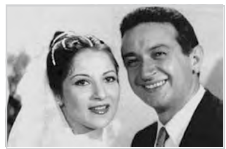
الضمان نور الشريف عاد مرة أخرى وأكد خبر طلاقه من زوجته الفنانة بوسي بعد أن كان قد قام بتكذيب الخبر. واكتفى الشريف بالقول إنه أراد فقط تأجيل إعلان الطلاق فترة من الوقت، فيما قال مدير أعماله ان حرص الضمان نور على مشاعر بنته ربما كان وراء نفيه

عبد الأضحى الماضي، وظل في طي الكتمان بين الطرفين، ولم تعلم به ابنتاهما مي وسارة إلا أخيراً، وذلك ، عكس تأكيد نور الشريف أن الطلاق وقع قبل سفره لمهرجان برلين ورجحت مصادر في الوسط الفني، على صلة وثيقة بالسبب بالطرفين، أن السبب الحقيقي وراء وقوع الطلاق هو اكتشاف بوسي تعلق نور الشريف بممثلة تونسية شابة، وقالت مصادر مقربة من الأسرة أن نور الشريف انتقل للإقامة بالفيللا التي بناها هو وبوسي في مدينة الإنتاج الإعلامي بجنوب الجزيرة. وكان أول عمل فني جمع بين نور وبوسي مسلسل "القاهرة والناس" للمخرج محمد فاضل في عام ١٩٦٩م الذي قدمهما كزوجين الضمان نور الشريف عاد مرة أخرى وأكد خبر طلاقه من زوجته الفنانة بوسي بعد أن كان قد قام بتكذيب الخبر. واكتفى الشريف بالقول إنه أراد فقط تأجيل إعلان الطلاق فترة من الوقت، فيما قال مدير أعماله ان حرص الضمان نور على مشاعر بنته ربما كان وراء نفيه الخبر. ومن ناحيتها أكدت بوسي خبر الطلاق قائلة عنه إنه تم في هدوء مراعاة لابنتيهما سارة ومي، ولكنها رفضت التعليق على الأسباب التي أدت للطلاق وقالت إنها تعتبر ذلك من أسرار حياتها الخاصة. وترددت أقوال ان الطلاق تم قبل