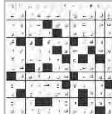
حل العدد السابق

21 اب 20 ايلول في مجال العمل تثار حتى الوصول الى هدفك لأنك شخص ذو طموحات كبيرة ، تحتج على مسالة عائلية وياخذ أفراد العائلة برأيك للبدء بمشاريع جديدة.