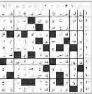
حل العدد السابق