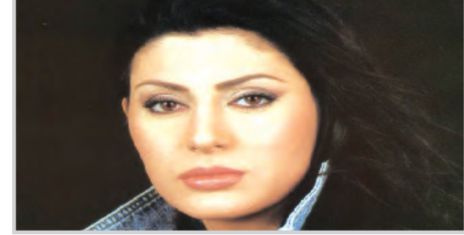
وتتم خلال الحلقة استضافة امهات