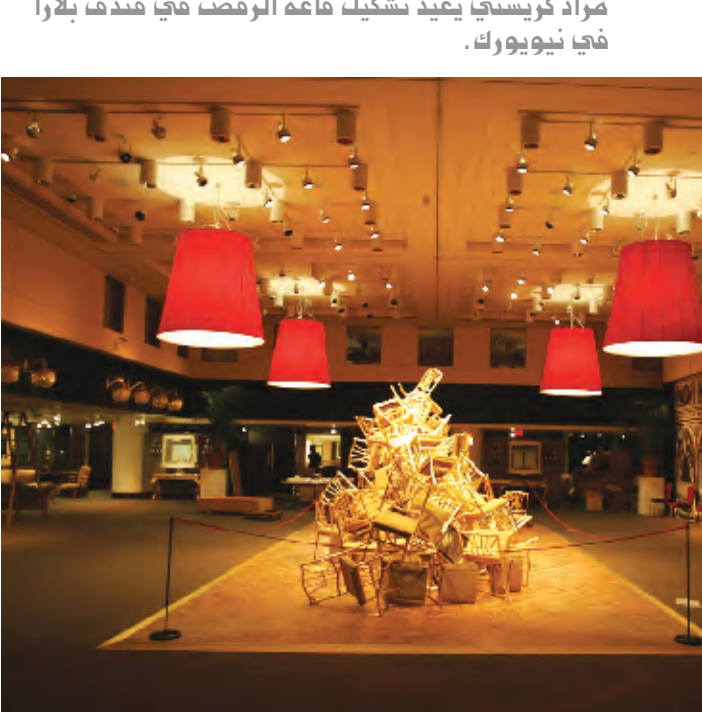
مزاد كريستي يعيد تشكيل قاعة الرقص في فندق بلازا في نيويورك.