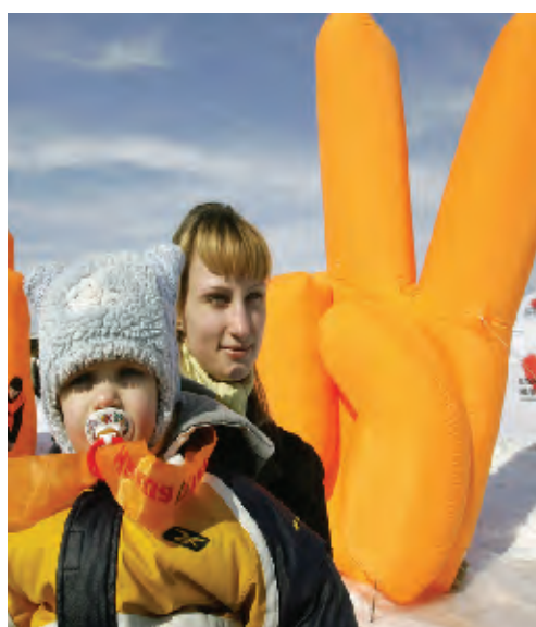
امرأة تحمل طفلها الذي يرضع من دمية على شكل فيكتور بوشينكو الرئيس الاوكراني / في كييف