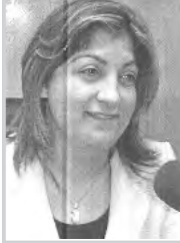
د. جوات فؤاد مصصوم

واجابت السيدة وزيرة الاتصالات الدكتور جوان فؤاد مصصوم على اسئلتنا مؤكدة على سعي الوزارة لتطوير قطاع الاتصالات بكل جوانبه وان المشاريع المهمة التي ستجزم لعام ٢٠٠٦ هو عمل مشروع نصب منظومة الهاتف