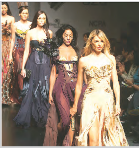
عارضات ازياء يعرضن ازياء الطاووس في مدينة مومباي الهندية بمناسبة اسبوع الموضة.