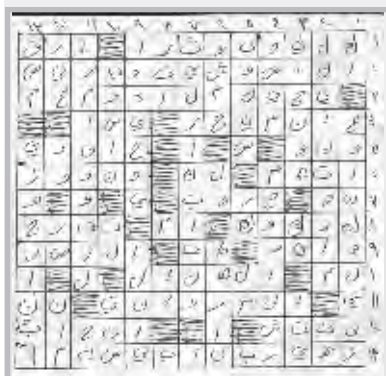
حل العدد السابق