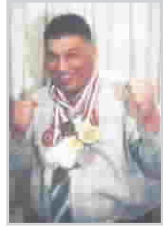
بغداد / كروية كاظم

بعد اسماعيل خليل نجم منتخب العراق للملاكمة قبل عقد من الزمن اللاعب الاول المعروف على الصعيد الشعبية والجماهيرية ليس فقط في العراق وحده بل في اسيا كلها كونه بطلاً اولمبيا واسيويا كانت بداية ظهور اسماعيل على مسرح الشهرة في بداية الثمانينيات وتحديدا عند احرازه المركز السادس في مسابقة الملاكمة في اولمبياد موسكو عام ١٩٨٠ وبعدها بفترة وجيزة اصبح اسماعيل اكثر شهرة من نجوم منتخبنا الكروي اذذاك (فلاح حسن، حسين سعيد، عدنان حمد، كريم صدام، حبيب جعفر، احمد راضي) وللحق فان خليل يستحق كل هذه الشهرة والاهتمام الكبيرين فهو على الصعيد الشخصي انسان متواضع وذو قلب طيب ويحب مساعدة الآخرين ولم يدخل كلمة الغرور في قاموسه ابدا وهو من صنف الكبار من النجوم الرياضيين الذين يكتسحون الدنيا بنتائجهم المبهرة وقد تدهشون اذا ذكرت بان اسماعيل خليل في الحقيقة هو عامل عراقي بسيط حاله حال عمالنا العراقيين يكد