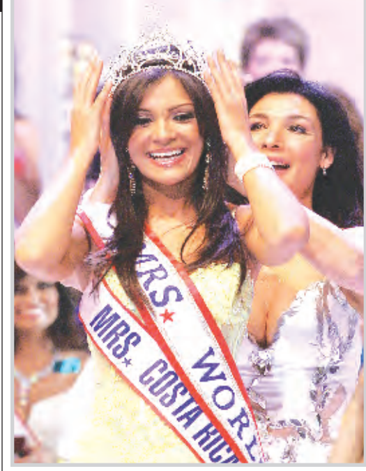
* ملكة جمال كوستاريكا تقف امام الكاميرا.

* مربي النحل الكوري في حملة احتجاج ضد اليابان.