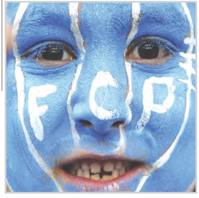
* وجه برتغالي بمناسبة احد الاعياد.