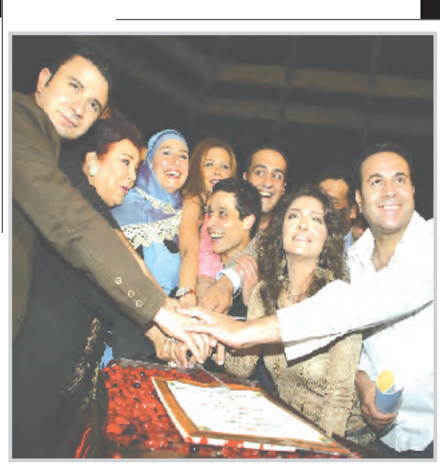
* فريق التمثيل والانتاج للفيلم المصري (كاملا الاوصاف)