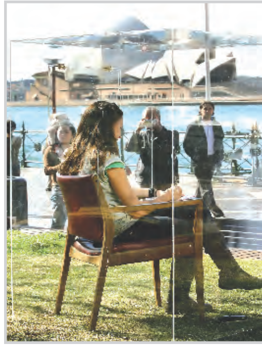
* الكاتبة المسرحية الاسترالية كاترين جيونانلي تكتب على سواحل سيدني.