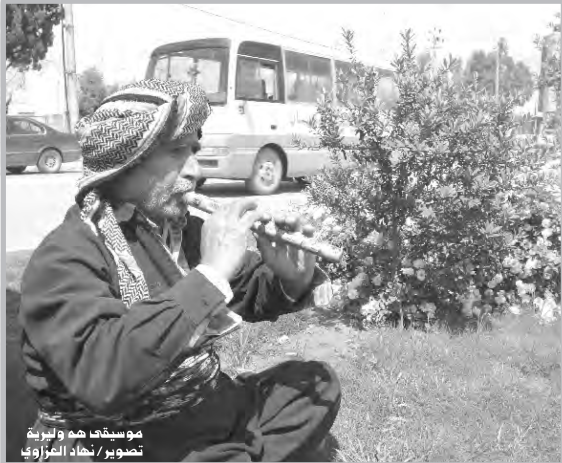
موسيقها هم وليربة

الكثيرة في الصورة بما لا يزيد عن ٢٥٦ لونا ويستخدم هذا النمط في الصور المتحركة أو التي تستخدم للإنترنت. ينصح استخدام هذا النمط بعد اتمام عملية تحرير الصورة لان العديد من خيارات تحرير الصورة سوف تتوقف بعد تطبيق هذا النمط مثل تطبيق المؤثرات Effects، أما في حالة الحاجة إلى تحرير الصورة قم بتحويلها إلى النمط RGB بصورة مؤقتة ثم قم بتحويلها إلى نمط Indexed color mode عند اتمام المهمة - Image -Mode -Indexed Color عند اختيار نمط اللون المفهرس يظهر لك مربع الحوار الخاص بهذا النمط وبه العديد من الاختيارات لضبط وتحديد الكيفية التي سيقوم على أساسها البرنامج بتحويل نمط الصورة.