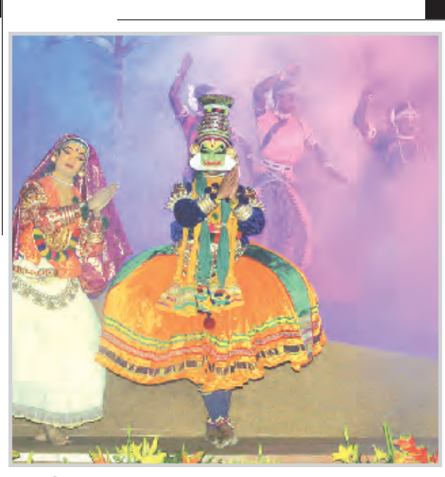
* الراقصون الهنود يحتفلون في مدينة حيدر آباد.