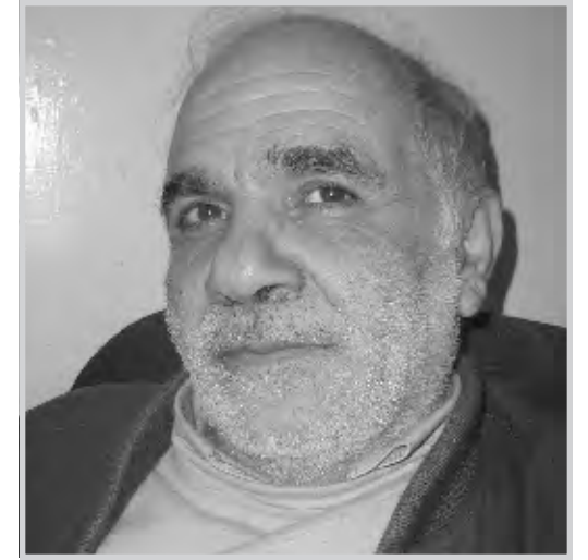
سهيل سامي نادر

في رواية "التل" لسهيل سامي نادر، يطالعنا المنقب الاثري الدكتور فؤاد، وهو في موقع مفكر محموم يدس انفه في حفر التراب وحفر الحياة، ويوازن بين وصف الحضرية ووصف الحياة الداخلية في ليج نرف حضاري دائم، إذ يجد ومجموعة العاملين معه هنا وهناك، التبعثر نفسه والضياعات نفسها، التحلل والثلوم والبقايا والكسور، فيؤلفون منها صوراً ناقصة ومزيفة، معتقدين في كل مرة بوجود عمق لم يصلوا