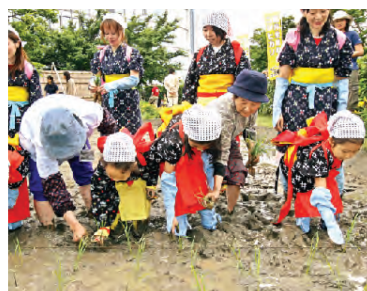
اناس يرتدون ملابس تقليدية يزرعون المزروعات على سطح دار للسينما في طوكيو