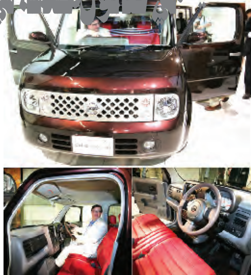
شركة نيسان اليابانية تعرض منتجاتها الجديدة

٤- الطالبة باكتيرينا ليفتونوفا تقدم عرضاً فجيا أثناء حفلة مسابقة ملكة الجمال فيا جامعة بيلاوسيا فيا مدينة فسك