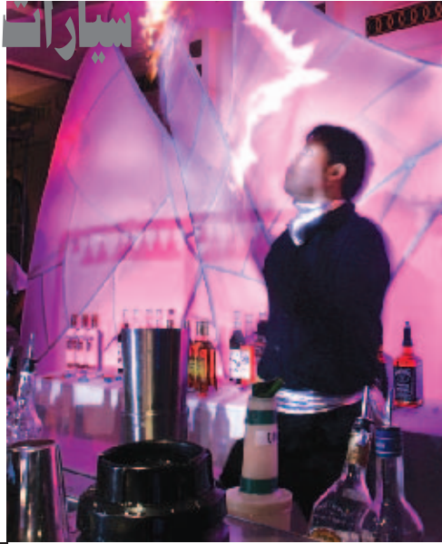
ساقيا هنديا يشارك في مسابقة لعرض مهارات السقاة في نيودلهيا

لاجنوت من تيمور الشرقية في كنيسة بمدينة ديلاي حيث يخشون العودة الى منازلهم بعد اسابيع من الصراعات