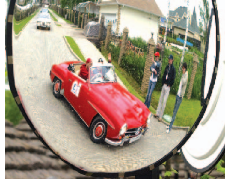
سيارة فورد موديل ١٩٦٢ تشارك في سباق للسيارات في حيدر آباد