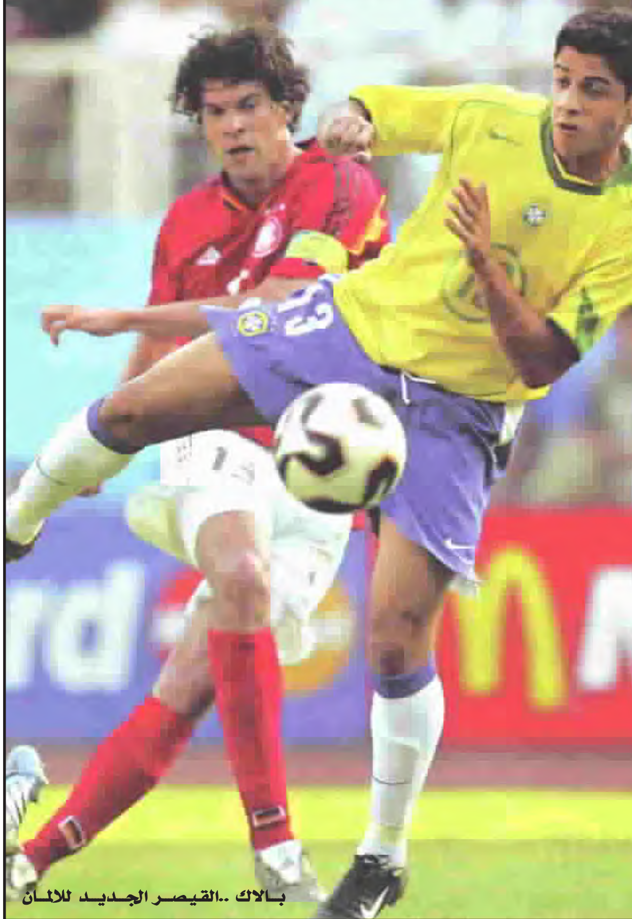
بالاك .. القيصر الجديد للالمان