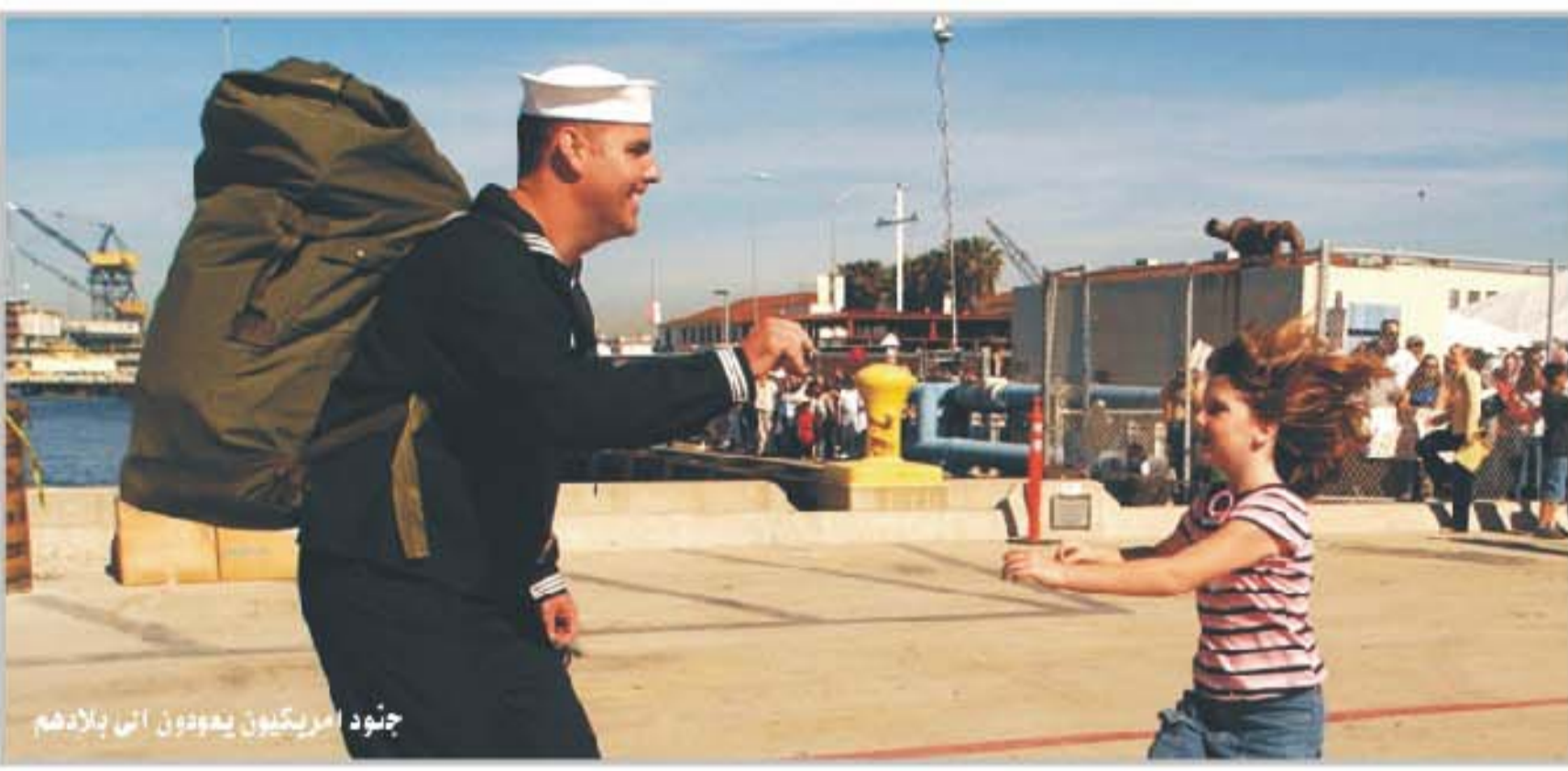
جنود أمريكيون يعودون إلى بلادهم

الموصل /نزار عبد الستار علمت (التي) ان شركة فورد للسيارات كشفت مسألة إنشاء مصنع لسيارات في مدينة الموصل وذكر مصدر من المحافظة ان شركة السيارات الأمريكية وكالتي شركة مستبوشي اليابانية بصحابة مع المحافظة إقامة العلية من المشاريع الاستثمارية في المحافظة ومن المؤمل ان تستغل فورد مرفق قرات التصنيع العسكري السابقة في إقامة هذا المشروع. كما علمت (التي) ان العلية من الشبكات غرب في استثمار من منظمة العليات السياحية لإقامة الفنادق والرافق السياحية الأخرى ويتنافس أصحاب المشاريع في الوقت الحاضر لوضع عقد استثمار منظمة العليات لاغراض سياحية وتشير مصادر التي ان وجود عبة في منح الاستثمار لشركات الأجنبية وخاصة المشاريع الكبيرة التي تشمل رؤوس أموال ضخمة. وتشير الموصل من أهم مناطق الاستثمار في العراق وذلك لوفرة المواقع السياحية الخلقة والخصائص الواسعة والمناسبة لإقامة المشاريع الصناعية والزراعية أيضاً.