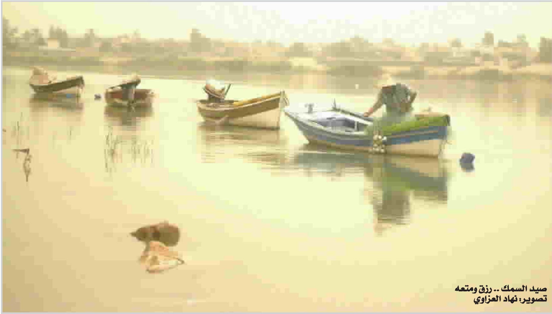
صيد السمك .. رزق ومتعه