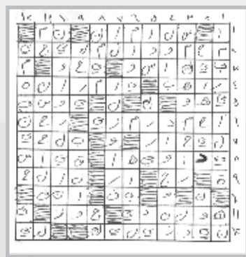
حل العدد السابق