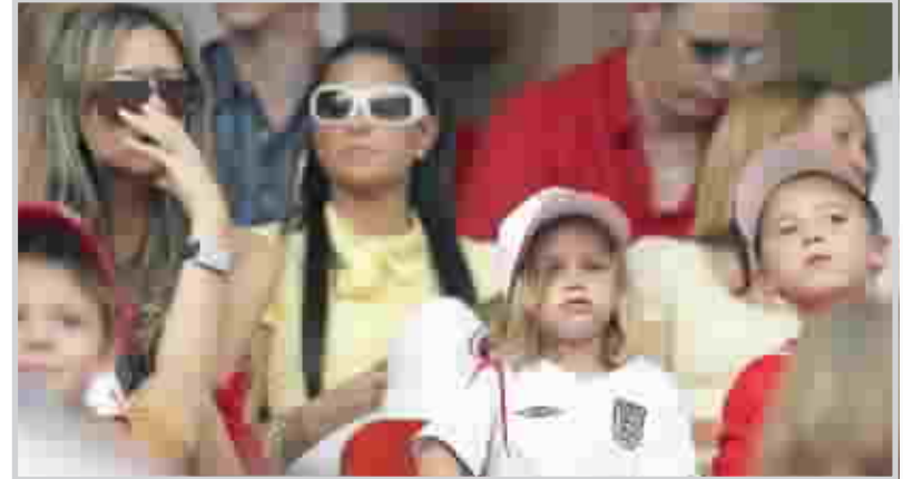
فيكتوريا شغلت اضاء المونديال

الأمير بل أسهت الضوء على هذا العرض هذا الخروج وتقديم كل ما هو جديد لكشف ومؤخراً عرضت الصحف الإنكليزية قضية زوجات وصديقات نجوم المنتخب الإنكليزي، التي الفت باللائمة عليهن ولو بطريقة غير مباشرة حول مدى تدخلهن لدى لاعبي المنتخب، أو بالأحرى الية مراقبتهم النجوم، وهو ما انعكس سلباً على التغطية والوكبة التي وجدتها تلك الزوجات والصدقات من قبل وسائل الاعلام العالمية عامة والإنكليزية على وجه الخصوص. وفي هذا الإطار، كشفت تقارير صحافية إنكليزية أن الاتحاد الإنكليزي لكرة القدم يفكر ملياً في إمكانية إبعاد الزوجات والصدقات عن لاعبي المنتخب. حيث يسعى من خلال ذلك إلى منع سفر الصديقات اللعابة مع لاعبي المنتخب في البطولات والاستحقاقات الكبرى التي يشترك بها المنتخب الإنكليزي. ويقول مراقبون ومختصون أن الهالة الإعلامية الكبيرة التي وجدتها زوجات وصدقات نجوم إنكلترا أدت بشكل مباشر إلى زيادة غير عادية في توزيع الصحف البريطانية بعدما هتمت كثيراً بجولات التسوق لزوجات وصديقات اللاعبين في المساء خلال حفلاتهن في أحد الفنادق الخاصة والمائية القريبة من مقر المنتخب الإنجليزي وصلت إلى ٦٥ ألف استرليني، وراحت تلك التقارير الصحافية تكشف عن أن بعض زوجات لاعبي الكرة اللعابة كن يتصلن باللاعبين حتى بذات العيون الخلابه ، و التي ريفز خطيبة فرانك ليمبارد المشهورة بلقب الساحرة و شيرلى تويدى خطيبة أشلى كول المقبلة بخاطفة القلوب، إلا أن المصورين أولوا اهتماماً بجميلة الجميلات فيكتوريا بيكهام نجمة الفريق الفئاني السابق سياسي جيرلز التي أصبحت هدفاً أساسياً لهم لتعيد للأذهان مطارداتهم للبدى ديانا حتى أنهم كانوا من الأسباب الرئيسية التي أدت إلى مصرعها في حادث سيارة في باريس مع صديقها المصري الملياردير دودي الفايد.