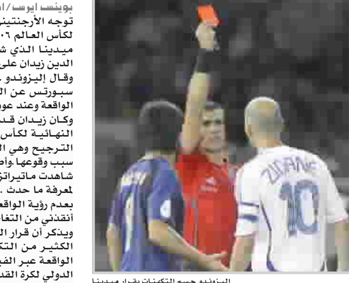
اليزونو حسم التكهنات بقرار ميدنا

لندن / الوكالات أكد مهاجم منتخب إنجلترا لكرة القدم واين روني أنه لم يتعمد أن يمد يده على اللاعب البرتغالي ريكاردو كارفاليو في مباراة دور الثمانية ببطولة كأس العالم السابعة بألمانيا بين إنجلترا والبرتغال التي طرد روني خلالها بسبب هذه الواقعة. ويع سيرته الذاتية التي نشرها صحيفة "ميل أون صندي" البريطانية على حلقات تحت عنوان "قصة حياتي حتى الان" أكد روني أيضاً عدم وجود أي خلاف بينه وبين زميله البرتغالي بصوف نادي مانشستر يونايتد الإنجليزي كريستيانو رونالدو وأن أي شائعة ترددت حول وجود مشكلة كبيرة بين اللاعبين هي من اختلاق وسائل الاعلام. وكتب روني يقول "سأذهب إلى قبري وأنا مصر على أنه كان مجرد حادث (عندما داس على كارفاليو). لم أتعمد ذلك.. عندما اختل توازني إلى الخلف أدركت أنني دست على لاعب كان ممدداً على الأرض. قبل أن أكتشف أن هذا اللاعب هو كارفاليو، وأدركت أن قدمي وطأت فيما بين ساقيه فيما يعد أسوأ مكان للاصابة ولكنه كان حادثاً". وأضاف روني "لم أصدق أن الحكم الذي كان قريباً جداً مني لم يدرك ذلك، ولكنه ربما كان قريباً أكثر مما ينبغي فكان كل ما رآه عن كثر هو اللاعب الممدد على