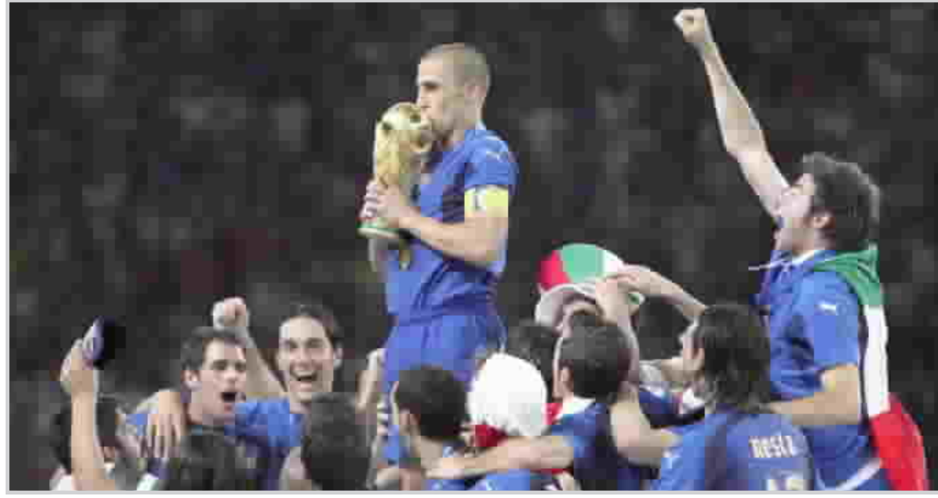
خبية امل كانافارو أفسدت فرحة الطليان

يأتي تشيلسي ومانشستر يونايتد الإنجليزيان وريال مدريد الإسبانيان في القائمة المشاركة في كأس العالم الماضية