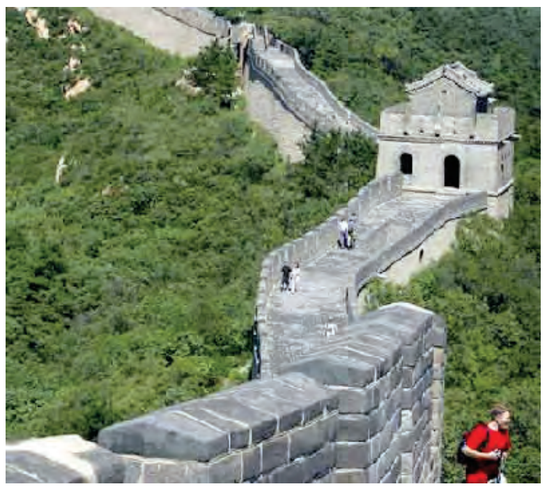
سور الصين التاريخي

القاهرة: تحسنت الحالة الصحية للروائي المصري نجيب محفوظ بعد إجراء جراحة في رأسه بمستشفى الشرطة بالعاصمة القاهرة. وقال رئيس اتحاد كتاب مصر محمد سلماوي إن محفوظ (٩٥ عاما) اختل توازنه في منزله وسقط على الأرض وجرح في مؤخرة رأسه. وأضاف أن الأطباء أجروا جراحة لوقف النزف وقد أفاق من التخدير وحالته مستقرة. وكان محفوظ تعرض لمحاولة اغتيال فاشلة بسكين في تشرين الأول عام ١٩٩٤ وأصابت السكين رقبته