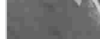
الروائي فؤاد التكرلي

الاجتماعي البائس للطبقات الاجتماعية الفقيرة والمتوسطة.