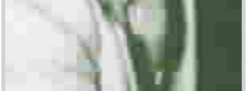
الروائي مهدي عيسى صكر