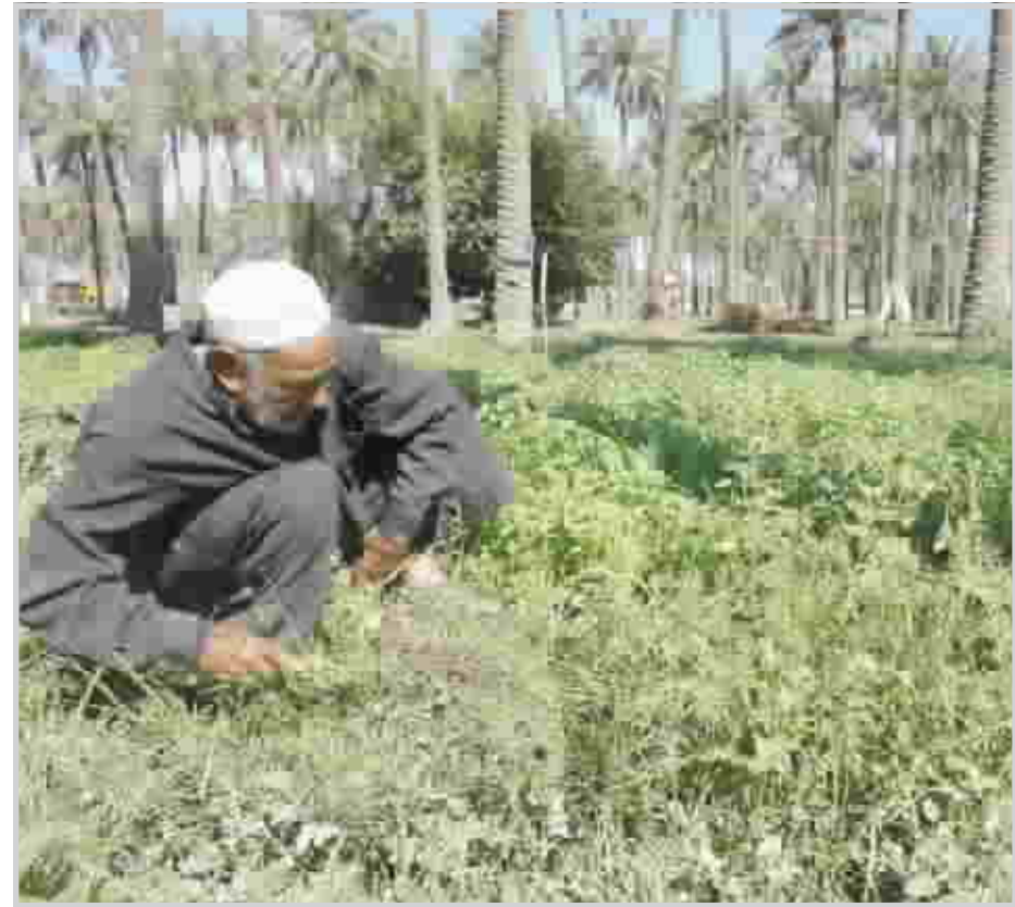
مزارع يتابع زرعها في بعقوبة