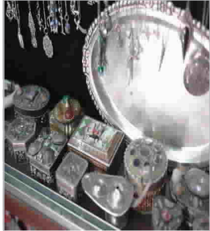
مشغولات يدوية من صنع الحرفيين العراقيين المهرة

تتراصف مجموعة من محال باعة التحف اليدوية بمحاذاة جامع الاصفية ساحة الميدان، لتشكيل معرضا مدهش من الاعمال اليدوية