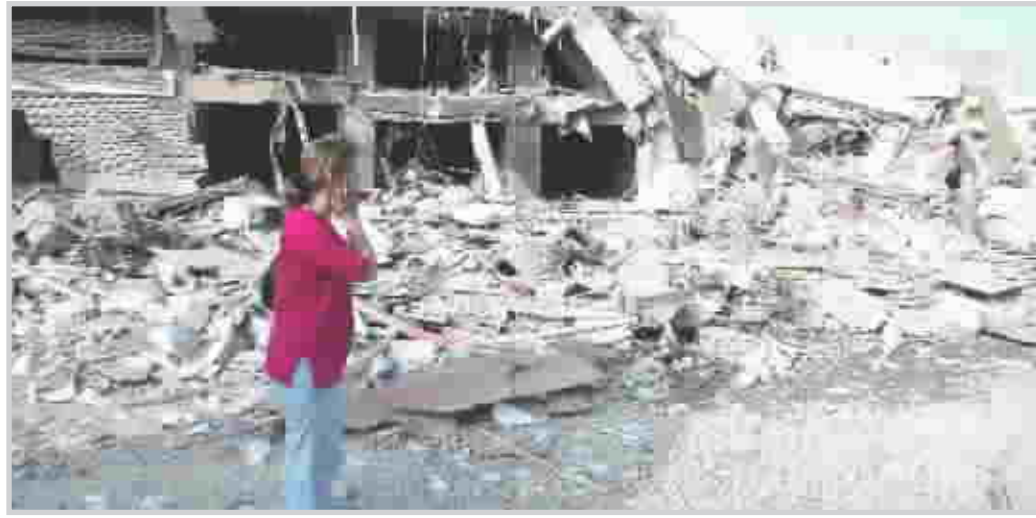
من آثار القصف الاسرائيلي للاحياء السكنية في بيروت

خلال القصف الجوي الاسرائيلي احدى محطات الوقود في منطقة الحنية. كما اشار البيان الى ان السفارة مستمرة في ايواء بعض العوائل