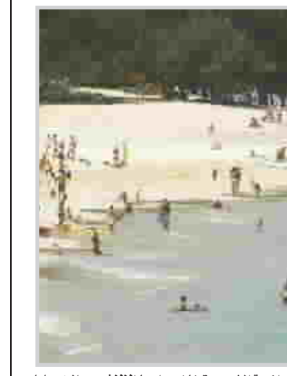
اشعة الشمس تخلف وراءها الالاف من الضحايا

ولكن الافراط في التعرض لها يرتبط بمجموعة متنوعة من المشاكل الصحية والقاتلة، ولا يمكن رؤية الأشعة فوق البنفسجية أو الشعور بها ولكن هناك مؤشرا لقياسها وكلمتا ارتفعت هذه المؤشرات زادت المخاطر على الجلد والعين.