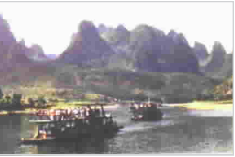
أحدى المدن الساحلية في آسيا الصغرى

في باجينغ أيضا حي للمسلمين ومقبرة يقدر عدد القبور فيها ٢٥٠٠٠٠ قبر في حديقة تعود الى القرن الثالث عشر. كان طريق الحرير جغرافيا بحدود الممالك وثقافيا بحدود الحضارات.