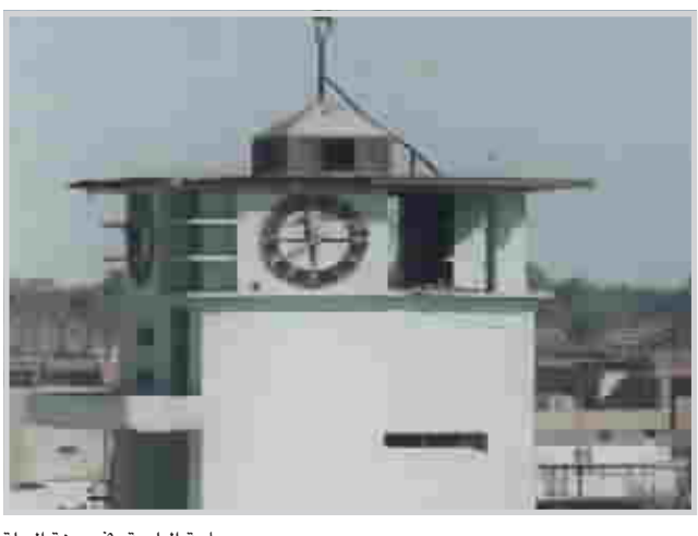
ساعة البلدية في مدينة الحلة

أفقي ١، فنانة عراقية متميزة (ممثلة وكاتبة دراما). احد المشهور. ٢، محافظة عراقية (م). من اسماء السيد (م). ٣، حرف مكرر. واهن. من امراض الجهاز التنفسي (م). ٤، رقيق الاحساس (م). يمارس احد الالعاب الرياضية (م). ٥، الاحتيال (م). حرف + انثى ٦، احد الوالدين. ممثل ومخرج عراقي من الرواد. ٧، حاجز نصف (تينة). رقاد. ٨، الذي يتاجر بالاسماك (م). ٩، الرحيل او الفراخ (م). ١٠، الغائب (م). ١٠، الرفاهية (م). نصف (سهم). حرف مكرر. ١١، اسم علم مؤنث. وحدة وزن للذهب. ١٢، ضمير منفصل (م). بمعنى لا. طريق (م). عمودي ١، مطربة عراقية كبيرة. ٢، ممثل عراقي راحل من الرواد. ٣، ضمير متصل (م). سقي. ٤، عكس مصدره. ٤، لاح. الاجير (م). ٥، ممثل ومخرج عراقي متميز. ٦، مرتفع. للتاوه. للتعريف. ٧، يترك (م). ينسى (م). يجب كتمانها (م). ٨، يفيد. نافذتهم. ٩، غم (م). الكثير (م). نصف (ثلاث). ١٠، قبولهم. نصف (قيده). ١١، المنسوب لمحافظة عراقية. ثوب. ١٢، عاصمة اوربية. عاصمة عربية.