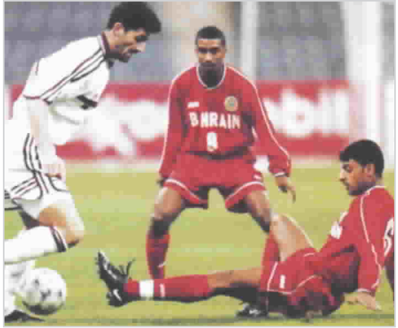
احدى مباريات كأس الخليج.. من الارشيف

وقال مدير البطولة، الحفل سيكون بمثابة العرس (الأولي) للحدث ككل، حيث حفل القرعة سيكون (مبهرا) وسيشهد الحفل حضور شخصيات وأسماء مرموقة في دنيا الكرة العالمية.