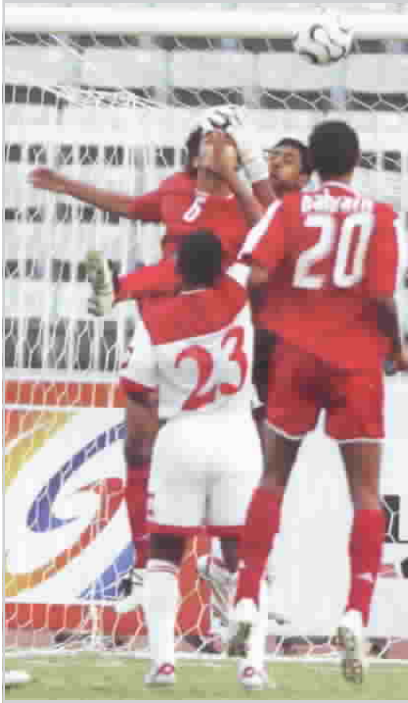
احمدى مبداربيات كأس الخليج١٧

من خلال الكثير من المؤتمرات الصحفية للإعلان عنها وذلك لترويج وتحفيز الشارع الرياضي حيث كلفت اللجنة شركة فيولا بهذه الحملة الترويجية وسيتم توقيع عقد رسمي معها قريباً. كما أشار إلى أنه تم الاعلان عن شعار الدورة سابقا حيث قال الرميثي: أن هذا الشعار ذوقنا واختيارنا ونحن راضون عنه كما أضاف أنه من الطبيعي ألا تتوافق جميع الأذواق.