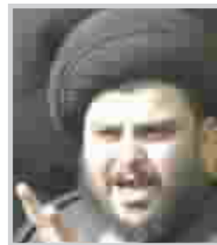
السيد مقتدى الصدر

وانطلقت التظاهرة التي نظمها مكتب الشهيد الصدر من امام مكتبه في المدينة باتجاه ساحة الصدرين وسط المدينة. وردد المتظاهرون هتافات "النار الثأريا لبنان" و"كلا كلا اسرائيل". وشيعت التظاهرات اللواتي ارتدين العباءات السوداء ثلاثة توابيت رمزية מושحة باللون الاسود كتب عليها "الجامعة العربية" و"الامم المتحدة" و"اطفال ونساء لبنان"، تعبيرا عن احتجاجهم على موقف الامم المتحدة والجامعة العربية ازاء الهجوم. من جانبه طالب مقتدى الصدر أمس الإثنين بوقف