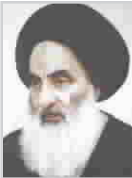
السيد علي الحسيني السيستاني كما ندد المرجع الديني الاعلى السيد علي السيستاني بالمجزرة التي ارتكبتها القوات

وطالب المجتمع الدولي بان "يبادر الى فرض وقف فوري لاطلاق النار ووضع حد لهذه المأساة المروعة". وحذر السيستاني من "ان