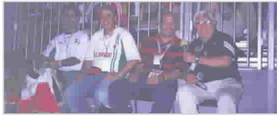
الزميل يوسف يحلل إحدى مباريات لفتاة اكادورية

والتحدي والعزيمة على تحقيق الفوز بينما كانت جماهير السامبا فريقهم من البطولة. ذهب بعض لاعبي البرازيل إلى الحانات يتقدمهم رونالدو للسهر وقضاء الليالي الحمراء قبل توديع المانيا. ولم تكن حادثة المنتخب البرازيلي الاولى او الوحيدة من نوعها بل ما حصل للمنتخب الانكليزي ومن نجومه يشابه ما فعله لاعبو السامبا فاللاعبون بيكهام ولامارادو وجيرارد وروني اشغلوا بزواجهم وصديقاتهم اكثر من الشغالهم بالفريق فكانوا يتركون التدريب ويذهبون للتسوق معهن مما اضطر احد المشجعين إلى كتابة لافتة ووضعها امام شقة بيكهام تقول ((ابق مع فيكتوريا وتسوق ما شئت وأترك شارة القيادة للاعب يريد ان يقدم لبلده اكثر ما يقدمه لزوجته المغنية))!! وكانت هذه الكلمات السبب الرئيس لاعلان بيكهام نزع شارة القيادة.