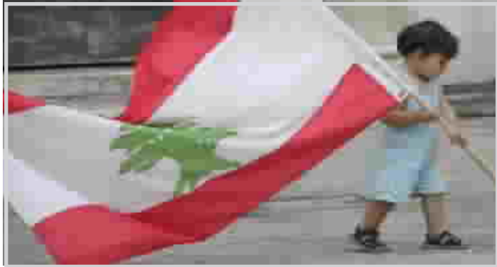
طفل لبناني يحمل علم بلاده

القاهرة/ مصر (CNN) اضطرت دار الأوبرا المصرية لإلغاء مهرجان "الإسكندرية الثاني للموسيقى العربية"، الذي كان مقرراً افتتاحه هذا الأسبوع بمدينة الإسكندرية على ساحل البحر المتوسط، بسبب الأحداث على الساحتين اللبنانية والفلسطينية.