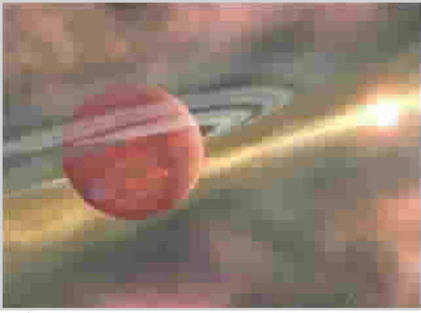
من مجموعة الواكب السيارة.. من الارشيف

أضعاف المسافة الفاصلة بين شمسنا وكوكب بلوتو، وهما موجودان في الحاضنة النجمية (منطقة تشكل فيها النجوم) "أوفيووتشوس" على بعد نحو 400 سنة ضوئية. ويقول الدكتور جاياوارضانا من جامعة تورنتو الكندية المشارك في البحث الخاص بالجرمين والمشور في مجلة "العلوم" إن الاكتشافات الأخيرة أظهرت تنوعاً مذهلاً في العوالم هناك، لكن هذين الجرمين هما الأكثر إدهاشاً وغرابةً".