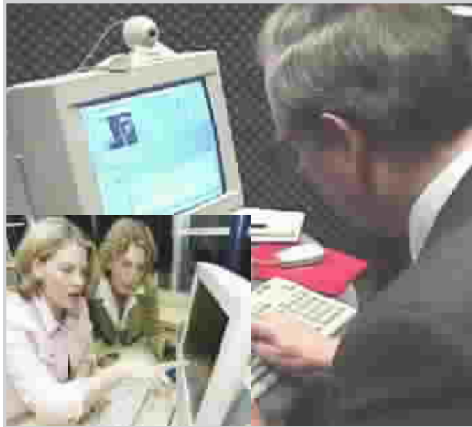
الأزواج يتبادلون الأحاديث عبر الإنترنت بسبب انشغالهم خارج المنزل

بتحديث ذاكرة الوصول العشوائي في جهاز الحاسوب وأعتقد أنه كان أمراً رومانسياً جداً. ويمكن أن تجعل حب الإنترنت أكثر متعة وإثراء بالعلومات من مخزونات البريد الإلكتروني الساخن التي تركت في أواخر التسعينيات، وفي هذا الإطار يقول ستانلي ليبير في مدونة (ويرد) "من الصعب إرسال أشياء مثل الصور والأصوات والناوين العالمية لمواقع الإنترنت من خلال الكلام المباشر". ويمكن رؤية مثال عملي على ذلك، ففي أحد مقاهي نيويورك جلس رجل وامرأة متجاورين يتحدثان الجعة ويتناولان الطعام ولا ينسان التماهة، وحميمياً مثل الاشتراك في قراءة كتاب بجوار مدفأة. ويقول كاترين -وهي زوجة تستخدم الإنترنت مع زوجها- إن "علاقتهما الجديدة غالباً ما تكون موضوع أبواب مدونتي (البلوغر) وغالباً ما أقول فيها أموراً لا أستطيع أن أقولها له بشكل مباشر". ويشير اثنان آخران متزوجان منذ 12 عاماً إلى أنهما لفترة وجيزة يتواصلان من خلال المدونات دون أن يناقشا حتى مشاعرهما وجها لوجه.