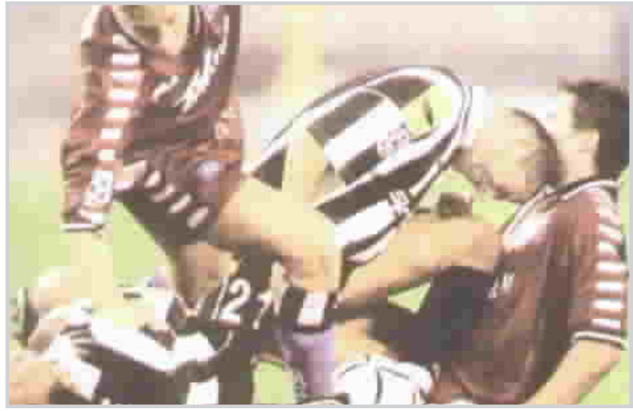
زيدان ينطح كينتس في وجهه

وما هو بكرر حادثة النتطح الثانية للإيطالي ماتيراتزي واستقطه ارضا في لحظة ضياع قاده إلى تسديد ضربة رأسية لا تليق به، بهتت صورة زيدان الجميلة وكأنه من الممكن ان يحطم في جزء من الثانية ما بناه بصبر وناة في سنوات