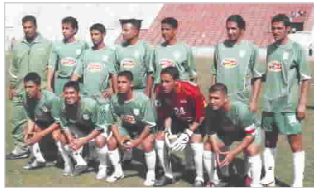
فريق الشرطة بكرة القدم