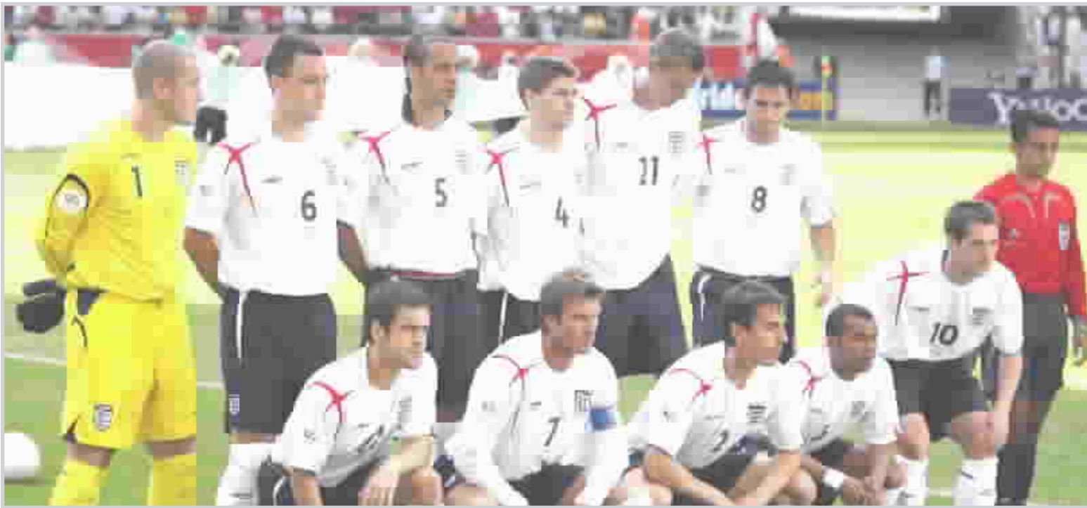
اوين اجرز الغائبين عن تشكيلة انكلترا الجديدة

من جهة اخرى اصبح المدرب (ليفربول) ودين اشتون (وست السابق لمنتخب انكلترا في كرة الكادر الفني للمنتخب