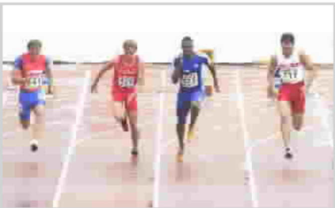
من منافسات بطولة العالم بالعباب القوى

وانتزعت برغكفيست التي كانت مرشحة لاحراز المعدن الاضفر، البرونزية بفارق المحاولات عن الشابة الكرواتية بلانكا فلاستش، في حين جاءت الروسية بليينا سليسارنكو بطلة اولبياد اثينا ٢٠٠٤، في المركز الخامس (١٩٩) وجاءت الذهبية البلجيكية الثانية بواسطة العداء الشهيرة كيم غيفارت في سباق ٢٠٠ م بعد ان قطعت المسافة بزمن ٢:٢٨ ثانية، متقدمة على الروسيين يوليا غوشتشينا (٢:٢٩٣ ث) وناتاليا روساكوفا (٢:٣٠٩ ث).