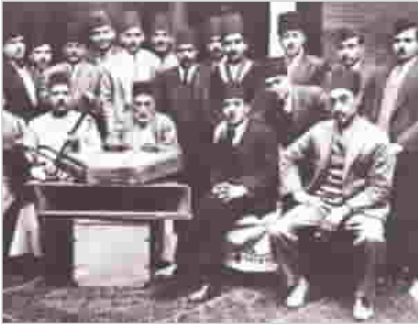
فرقة للمقام العراقي.. من الارشيف

لا يتيه القارئ هنا في خريطة الحاج حامد السعدي أبداً، بل سيعلم إن تصنيف الفصول، هو للاستدلال على طريقة القراءة.. أما المقامات.. فقد قسمها كما يجب، مبيناً بذلك الأصول فيها والضرع. وباعتقادي.. إن هذا الكتاب صالح لأن يكون مصدراً للتدريس، وإيضاً كمنهج للجامعات والمعاهد الموسيقية بما يفيض من اختصاص.