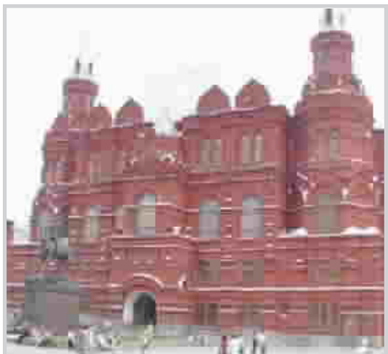
متحف موسكو الوطني

موسكو: أصدر الرئيس الروسي فلاديمير بوتين تعليمات بإجراء جرد للكنوز الثقافية في جميع أنحاء البلاد، من أجل معرفة عدد الأعمال الفنية المفقودة بعد حدوث سرقات منتظمة من متحف هرميتاج في سان بطرسبرغ. وقال دميتري مدفيديف النائب الأول لرئيس الوزراء إن بوتين طلب من الوزراء أن تبدأ اللجنة عملها بحلول أول سبتمبر/أيلول، موضحاً أنه أعطى تعليمات بأن تشارك وزارة الداخلية ووزارة الثقافة والشرطة الاتحادية ومكتب المدعي العام ووكالات أخرى في عمل اللجنة.