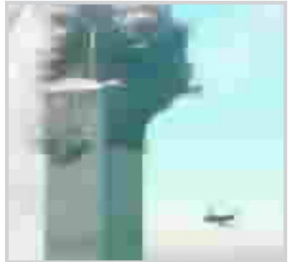
لحظة ارتطام الطائرة بمبنى التجارة العالمي

قصص إنسانية، ولكونها حقيقية، فنحن لا نملك أي حق بتغييرها".