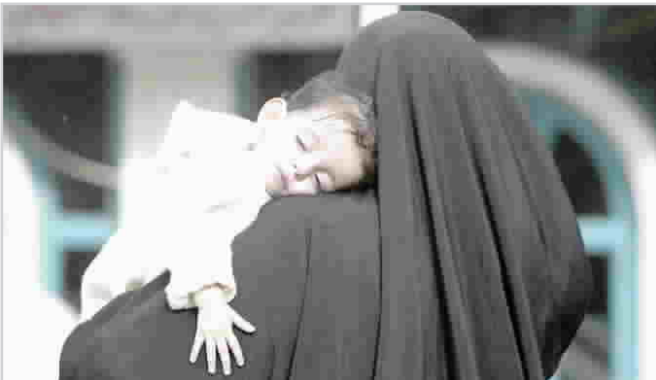
الفساد الإداري يطول حتى الخدمات التي تقدم للايتم والأرامل!

المؤتمرات كان من أهمها مشاركتنا في مؤتمرات عقدت في الجماهيرية الليبية والمملكة الأردنية وسوريا وإيران وكلها كانت تقع ضمن نشاطات المجتمع المدني في العراق بعد التغيير وعلى سبيل ذكر النشاطات اود ان اذكر باننا نسعى إلى ورشة عمل تنصب في محاربة الطائفة المقيتة ووقف نزف الدم العراقي. ويأتي ذلك ضمن اولويات مشاريعنا القادمة.