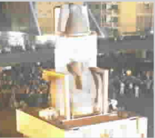
تمثال رمسيس الثاني

وكان التصفيق والصفير يعلو فور ظهور التمثال بعد كل منعطف بضخامته في الشوارع والعمارات التي تجاوز ارتفاع التمثال ارتفاعات بعضها.