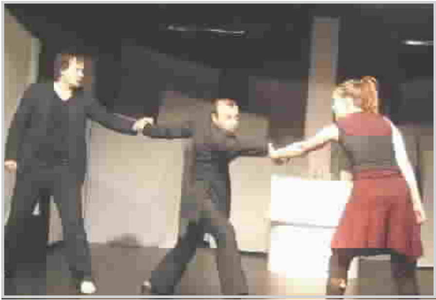
من المسرح العراقي الجاد