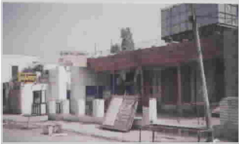
مقهى الشناشيل في البصرة بعد تحويله الى ورشة صناعية

سابق ان اكده لنا الباحث المرحوم يوسف ناصر العلي. اما حال مهتمى الشناشيل اليوم بعد ان احتواه الإهمال وتحول من مهتمى ما زال اسمه عالقا في ذاكرة رواده القدامى الذين هجره كمكان لكن رانحتها كمعلم تراثي من معالم مدينتهم ظلوا يعيشون زمانها السابق يوم كانت تصبغ بالنتخب السياسية والثقافية والأدبية والفنية وتلك العوالم السحرية التي كانوا يعيشون فيها لحظات التمتع بالألفة والحوارات الجادة في مختلف ميادين الحياة - أما الآن فإن مهتمى الشناشيل بقايا مكان غادره الزمن، بعدما امتدت اليه يد الإهمال وعدم الاهتمام بالحفاظ على هذا الأثر التراثي الذي