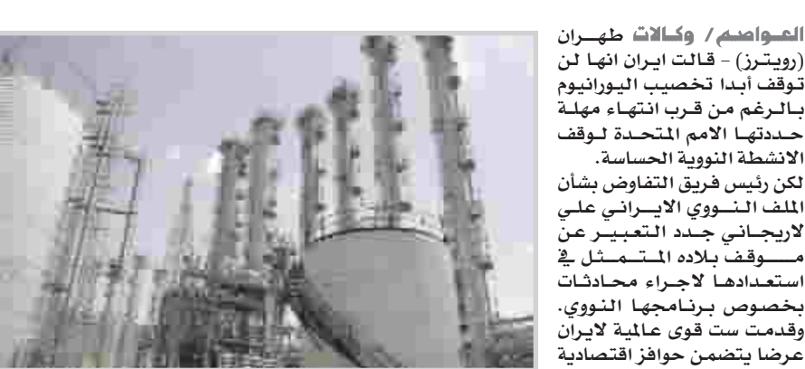
المنصات النووية الإيرانية