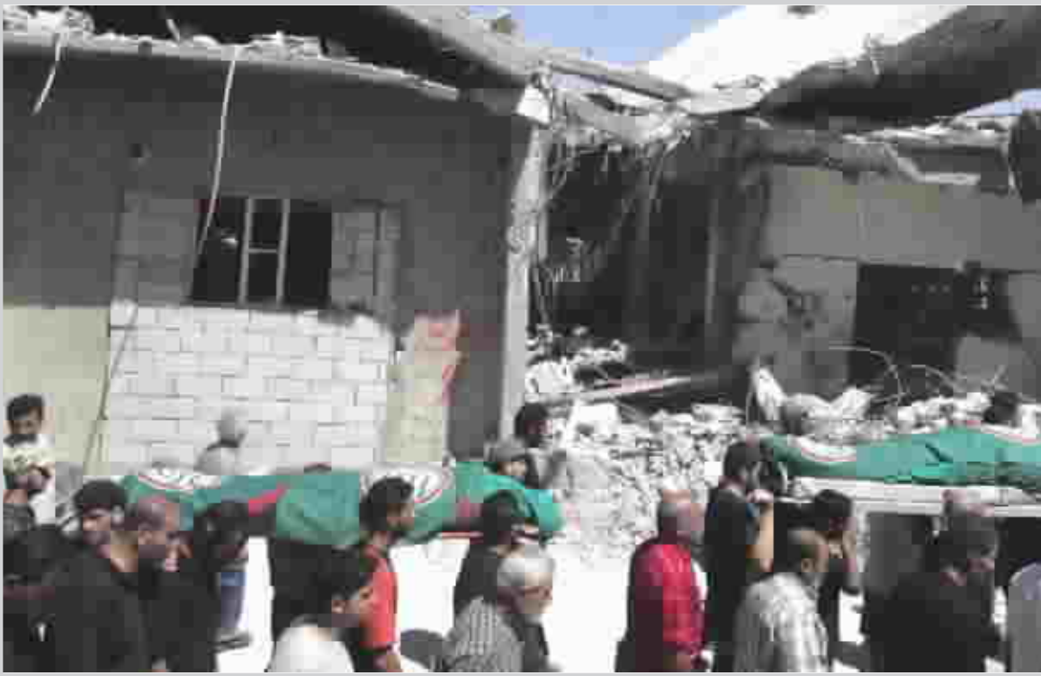
مخلفات الحرب الاسرائيلية على لبنان

ويقول حزب الله انه سيظل محتفظا بسلاحه، لكن نصر قال ان مقاتليه لن يحملوا السلاح علنا ما ان ينتشر الجيش اللبناني وقوات الأمم المتحدة في الجنوب. وذكر نصر الله أن إسرائيل تحاول فرض مطالب جديدة، مثل نشر قوات الأمم المتحدة في مطار بيروت والموانئ اللبنانية وعلى الحدود مع سوريا. وحول الحصار المفروض على لبنان، قال نصرالله بلهجة التحدي، "لا جدوى من الحصار.. فنحن رتبنا أمورنا على قاعدة حرب تدميرية قاسية وطويلة". وحول الخلافات الداخلية في لبنان، والتخوف من إقامة دولة بأداخل الدولة، في إشارة إلى شعبية وفوة حزب الله على الساحة، وبخاصة بدء توزيع الأموال على اصحاب البيوت التي هدمت، ووعده حزب الله إعادة البناء، قال نصر الله: "لا منطلق او مبرر من الخوف من حزب الله.. انا حامل لسلاحي للدفاع عن بلدي ضد إسرائيل".