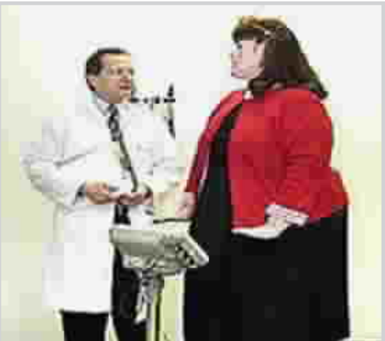
امراة بدينة تخضع للفحص الطبي . . من الأرشيف

وقد جاءت هذه النتائج من خلال الدراسة التي أجريت على ١١٢ امرأة تعانين من سرطان المبيضين الظهاري الذي يعد أكثر الأورام التي تصيب المبيضين، ثم قارنوا حالاتهن بـ ٥٣ امرأة تعانين من السمنة و٨٠١ امرأة أوزانهن معتدلة، ويشار إلى أن سرطان المبيضين هو مرض قد يحدث في أي عمر ولكنه يصيب النساء اللواتي تتوقف لديهن الدورة الشهرية.