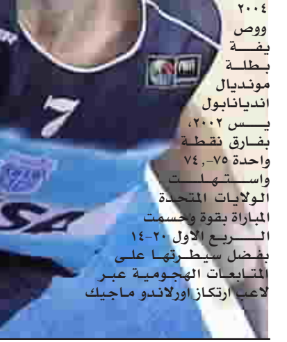
صراع اسبانيا ارجنتيني في شبه النهائي

الثالث لكن الجاهم وتصويتهم كانت عشوائية واكثر من المحاولات الفردية التي لم تجد نفعا لتتقدم اليونانيون وبفارق ١٤ نقطة ٦٩-٥٥، ثم قلص نجوم دوري المحترفي ن الفارق ١٠ نقاط