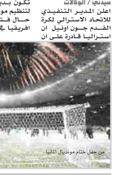
من حفل ختام موندريال المانيا

تكون بديلة محتملة لتنظيم موندريال ٢٠١٠. حال فشلت جنوب افريقيا في تضيف هذا الحدث. وقال اونيل في تصريح للتلفزيون المحلي: "اعتقد باننا سنكون جاهزين للقيام