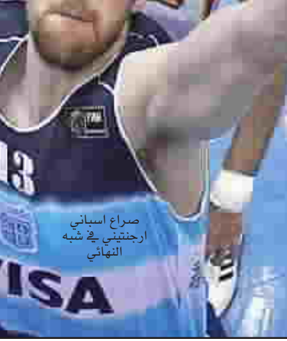
صراع اسبانيا ارجنتيني في شبه النهائي