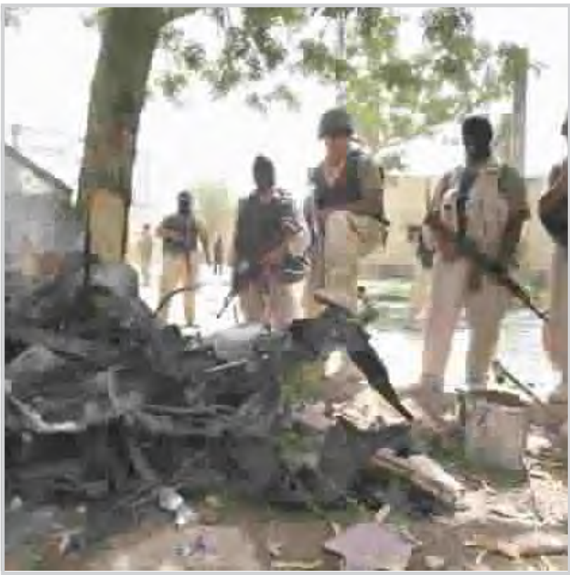
من اعمال العنف ... من الرشيف

مهجورة تماماً في اوقات الظهيرة وفقدت اسواقها المحلية حيويتها اذا اغتال مسلحون مجهولون احد الحلاقين في منطقة حي المعلمين الحي الجنوبي الغربي من المدينة صباح الاربعاء ايضا الى ذلك شهديساعات الثلاثاء فجر حسيينية في سوق المقدادية وسقوط عدد من قناير الهاون على الاحياء السكنية بالقرب من السوق الرئيسية الامر الذي ادى الى استشهاد اثنين من المدنيين واصابة خمسة آخرين بجروح بينهم امرأة نقلوا على اثرها الى المستشفى . الى ذلك اعلن اللواء واثق الحمداني قائد شرطة نينوى عن قيام قوة من شرطة نينوى بالقبض على جماعة مسلحة في مدينة الموصل اعترفت افرادها بمسؤوليتهم عن عدد من عمليات القتل في المحافظة التي طالت عناصر من الاجهزة الامنية ومدنيين. الى ذلك انفجرت صباح امس عبوة ناسفة عند مرور عدد من العجلات ذات الدفع الرباعي قرب منطقة كراج الشمال بالساحل الايسر من مدينة الموصل وقال احد العجلات من دون توفر معلومات اخرى عن الحادث فيما قامت القوات الامريكية بفرض طوق امني حول موقع الانفجار وحلقت المروحيات بكثافة فوق المنطقة.