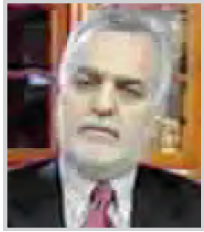
طارق الهاشمي نائب رئيس الجمهورية

مرهونا بالقوات البريطانية او قوات التحالف لكنه ايضا يعتمد على عمل و جهد القوات الامنية العراقية ومطلوب من الاحزاب والمجتمع المدني العمل معا لتوفير السلام والامن. وتقد اكد لي كل