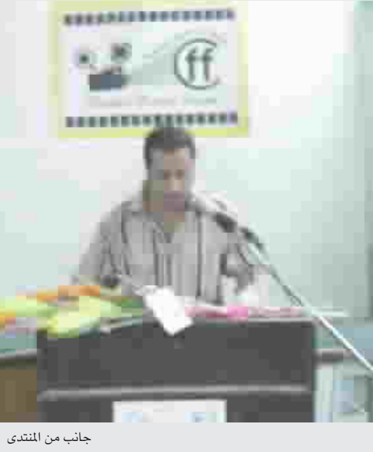
جانب من المنتدى