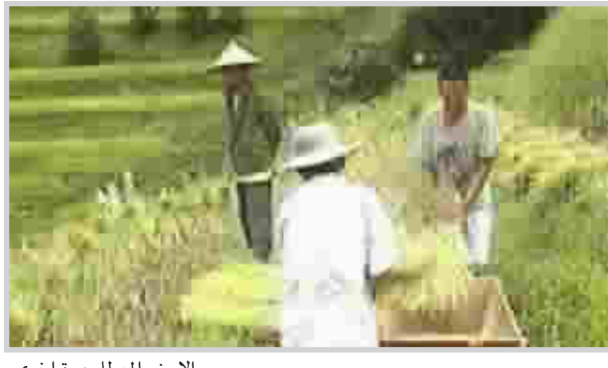
الارض المعطاء، مرة اخرى

منخفضة دون آثار بيئية ضارة . وقد استعان الفريق بقش الأرز وجريد النخيل وقصب السكر وجاءت النتائج لتؤكد تفوق الخلفات الزراعية في تحقيق معدلات برودة أعلى مع نفقة أقل مقارنة بالمواد الكيميائية . في الوقت الذي تم فيه تخلص أمن مثمر من قش الأرز الذي أصبح التخلص منه يمثل صداعا موسميا في مصر .