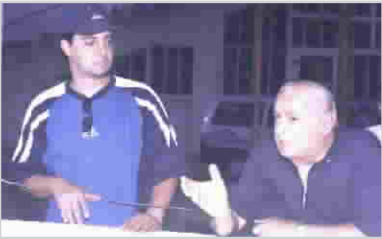
عمو بابا وراضي... درس نموذجي للمسامحة

بضاحة خطئه الذي لم يكن مقبولا من نجم كبير لم يلد رحم الكرة العراقية بموهبته سوى اثنين او ثلاثة لاعبين.