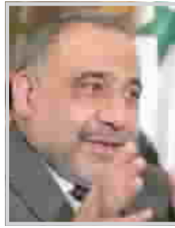
نائب رئيس الجمهورية الدكتورعادل عبد المهدي

التقى نائب رئيس الجمهورية الدكتورعادل عبد المهدي الشيخ خليفة بن زايد رئيس دولة الامارات وكبار المسؤولين في زيارة رسمية تم خلالها استعراض العديد من الملفات من اهمها الملف الامني والاقتصادي وملف اعمار العراق .