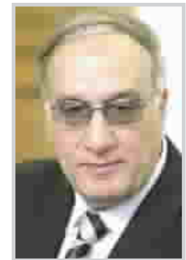
وزير الدفاع عبد القادر محمد جاسم

وأعرب الوزير الضيف عن دعم بلاده لتطوير وتطوير الجيش العراقي .