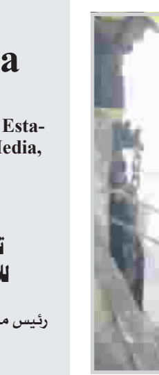
من اعمال العنف في بغداد التي حدثت مؤخرا

المصري وابو حمزة المهاجر. وكانت وزارة الداخلية قد اكدت الاحد الماضي ان وحدات تابعة للوزارة قتلت ثلاثة من تنظيم القاعدة في بغداد ضمن عملية تنشيط بقيادة ابو جعفر الليبي". وأضافت ان "مواجهات استمرت ساعة بين الشرطة والارهابيين المتمركزين في احد منازل منطقة الكرادة". واكدت ان "الشرطة عيبت نحو طن من المتفجرات مرتبة ضمن احزمة ناسفة وعبوات وادوات كهربائية ومفخخة وسبع قطع متفجرات من نوع سمكس زنة كل واحدة منها ثمانية كيلغ وصوصاق".