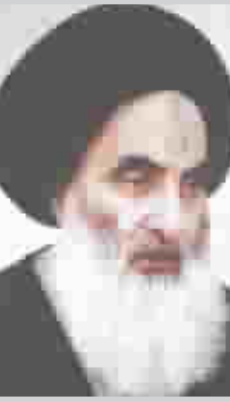
السيد علي السيستاني

محافظة على هذه الماهل التي تحدث فيها منيها الى ان هذا الامر "سيطعم الارهابيين والصداميين بالتمادي في اعمالهم الارهابية" مشيراً الى ان على الدولة إعادة الهيئة للقانون العراقي الذي سحقه النظام السابق. وتطرق الكردي في خطبة أمس الى ما شهدته مدينة كربلاء من أحداث ومواجهات مسلحة بداية الشهر الماضي نافياً ما تناولته بعض الصحف ان ما جرى هو صراع على وراثة الروتين المقدس معتبراً ذلك اهانة للمرجعيات الاربعة وتسقيط لها في نظر المواطنين.