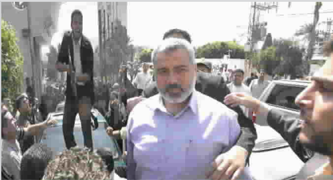
هنية لدى وصوله المجلس التشريعي... أمس

دعوة شريك من جانبه اعلن الرئيس الفرنسي جاك شيراك أمس الاثنين انه سيطلب خلال الجمعية العامة للأمم المتحدة عقد لقاء للجنة الرباعية الدولية للشرق الاوسط لاعادة بناء "الثقة" ومحاولة ايجاد "حل سلمي" بين الاسرائيليين والفلسطينيين. وتضم اللجنة الرباعية الولايات المتحدة والامم المتحدة والاتحاد الاوربي وروسيا. واوضح الرئيس الفرنسي خلال مقابلة مع اذاعة "اورويبا ١" الخاصة "للاسف فقدت الثقة" بين الاسرائيليين والفلسطينيين، "ويجب اعادة بناء هذه الثقة". واضاف شيراك "ساقترح في نيويورك من جهة ان يحصل في اطار اعادة الثقة واجهاد حل سلمي بين الطرفين، اجتماع للجنة الرباعية ومن جهة اخرى اجتماع يسمح بالتحضير لمؤتمر دولي يوفر للمجتمع الدولي الالتزام والوسائل التي تسمح لاحقا باحترام الضمانات التي اعطيت".