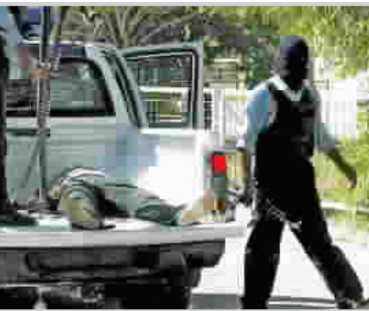
من ضحايا اعمال العنف