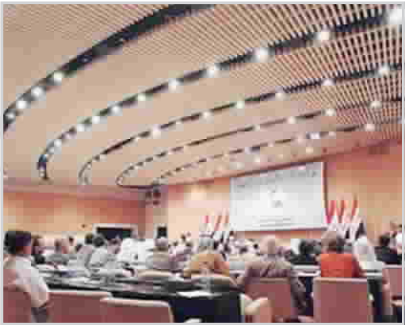
احدى جلسات مجلس النواب